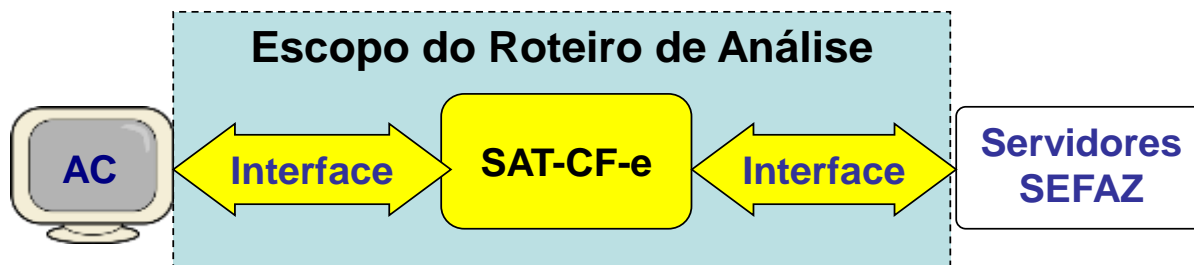
Figura 1 – Escopo do Roteiro de Análise

O roteiro de análise do software básico consiste na avaliação das funcionalidades do software, não contemplando a análise do código fonte e a identificação de riscos associados.